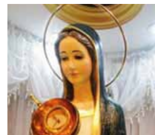
Nuovo Tabernacolo presente nella Cappella dell'Adorazione Perpetua presso il convento delle Agostiniane Recollette del Sacro Cuore di Gesù a Los Teques, dove sono state trasferite le reliquie del Miracolo Eucaristico di Betania.