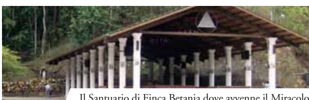
Il Santuario di Finca Betania dove avvenne il Miracolo