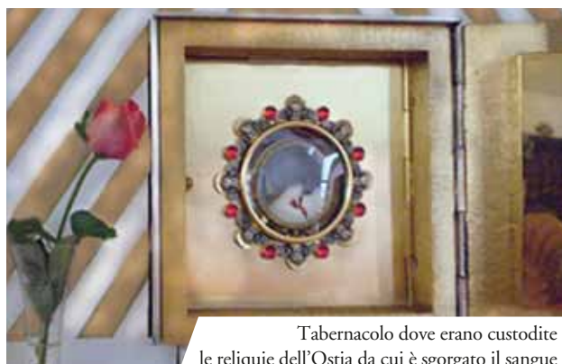
Tabernacolo dove erano custodite le reliquie dell'Ostia da cui è sgorgato il sangue