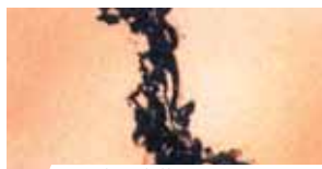
Analisi dell'Ostia. Strutture endocardiche