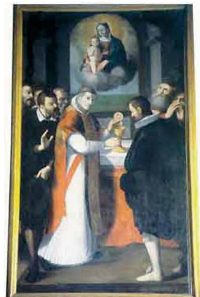
Antico dipinto raffigurante il Miracolo