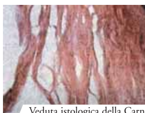
Veduta istologica della Carne

I 5 grumi di Sangue visti con una lente d'ingrandimento. Nel Sangue del Prodigio si riconoscono tutti i componenti presenti nel sangue fresco e miracolo nel miracolo, ciascuno dei 5 grumi di Sangue pesa separatamente 15, 85 grammi, che è l'identico peso dei 5 grumi pesati insieme!