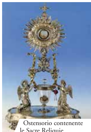
Ostensorio contenente le Sacre Reliquie

La Carne è ancora intera e il Sangue diviso in cinque parti disuguali che tanto pesano tutte unite quanto ciascuna separata».