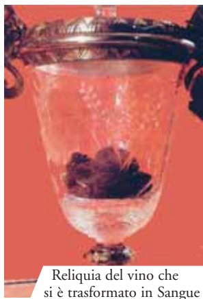
Reliquia del vino che si è trasformato in Sangue