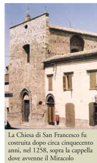
La Chiesa di San Francesco fu costruita dopo circa cinquecento anni, nel 1258, sopra la cappella dove avvenne il Miracolo