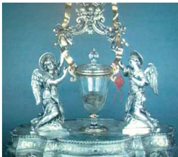
Il reliquiario del XVIII secolo contenente l'Ostia ed il Sangue rappreso, dono del munifico cittadino Domenico Coli.