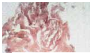
Un nervo vago

«La carne è vera carne umana (costituita da tessuto muscolare del cuore); il sangue è vero sangue (appartenente allo stesso gruppo sanguigno AB della carne); le sostanze componenti sono quelle di tessuti umani, normali, freschi; la conservazione della carne e del sangue, lasciati allo stato naturale per dodici secoli ed esposti all'azione di agenti atmosferici e biologici, rimane un fenomeno straordinario» (Relaz. Linoli 41311971).