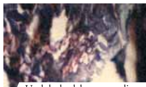
Un lobulo del tessuto adiposo