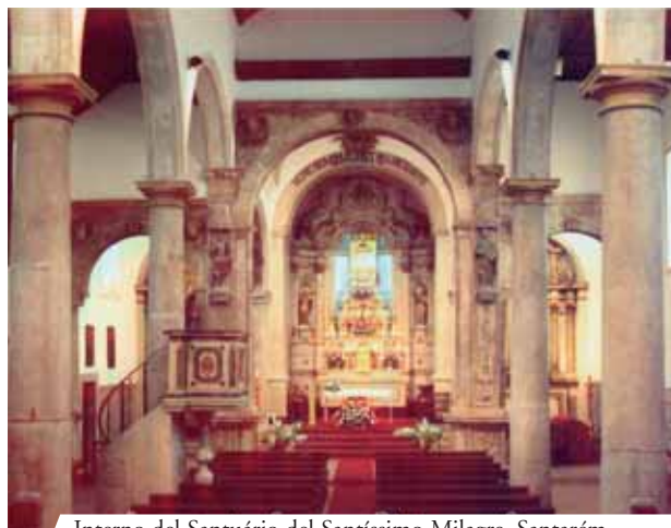
Interno del Santuário del Santíssimo Milagre, Santarém

Il Miracolo Eucaristico di Santarém, assieme a quello di Lanciano, è considerato tra i più importanti. Numerosi studi e analisi canoniche sono state effettuate sulle Reliquie. L'Ostia si trasformò in carne sanguinante e da questa fuoriuscì del Sangue. Ambedue le Reliquie si conservano ancora a Santarém nella chiesa di Santo Stefano. La casa degli sposi è diventata una cappella a partire dal 1684.