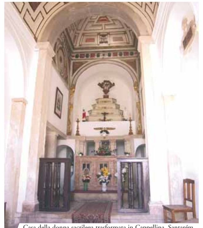
Casa della donna sacrilega trasformata in Cappellina, Santarém