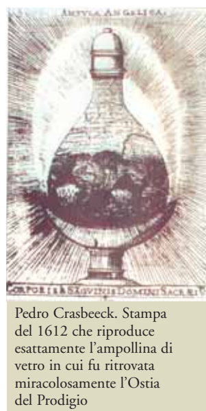
Pedro Crasbeeck. Stampa del 1612 che riproduce esattamente l'ampollina di vetro in cui fu ritrovata miracolosamente l'Ostia del Prodigio