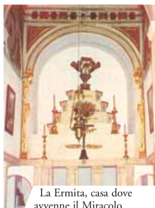
La Ermita, casa dove avvenne il Miracolo