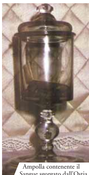
Ampolla contenente il Sangue sgorgato dall'Ostia