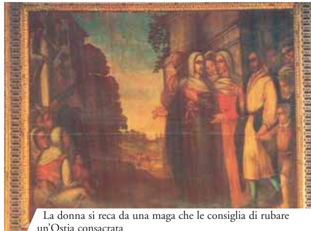
La donna si reca da una maga che le consiglia di rubare un'Ostia consacrata

La donna rubò l'Ostia e la nascese in un panno di lino che subito si macchiò di Sangue.