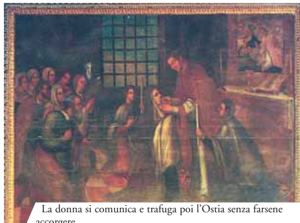
La donna si comunica e trafuga poi l'Ostia senza farsene accorgere