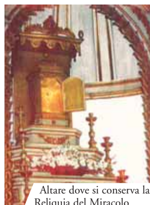
Altare dove si conserva la Reliquia del Miracolo