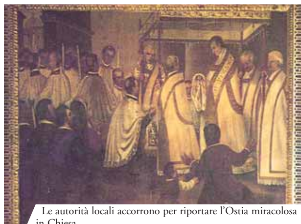
Le autorità locali accorrono per riportare l'Ostia miracolosa in Chiesa