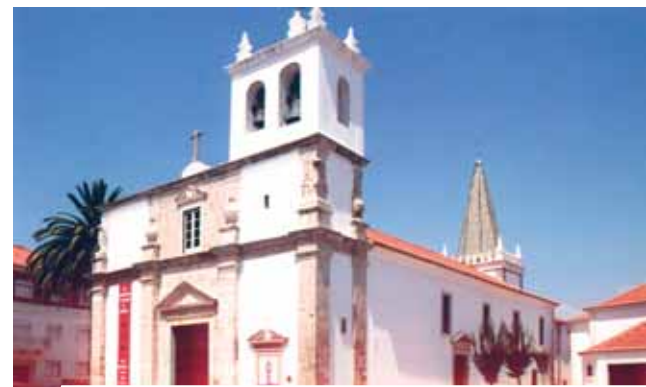
Santuário del Santíssimo Milagre, Santarém