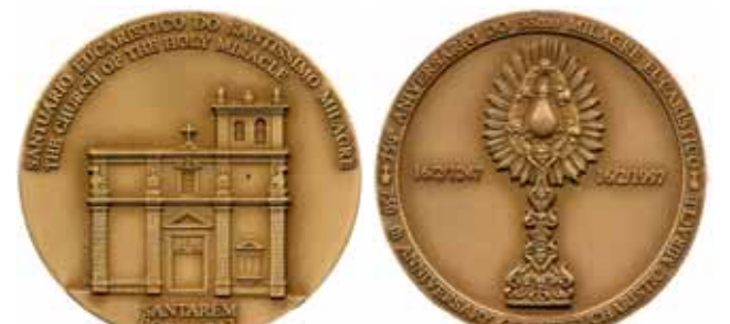
Medaglia commemorativa del Miracolo di Santarém