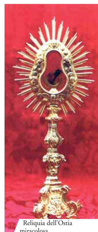
Reliquia dell'Ostia miracolosa

Concessero indulgenze plenarie a questo Miracolo Eucaristico diversi pontefici: Pio IV, San Pio V, Pio VI e Papa Gregorio XIV. Ancora oggi nella chiesa di Santo Stefano a Santarém è possibile ammirare queste preziose Reliquie. Secondo la data registrata nella copia del documento commissionato dal re Alfonso IV nel 1346, il 16 febbraio del 1266, a Santarém, una giovane donna, assalita dalla gelosia per il marito, si rivolse a una fattucchiera che le suggerì di andare in chiesa e di rubare un'Ostia consacrata per farne un filtro d'amore. La donna rubò l'Ostia e la nascose in un panno di lino che subito si macchiò di Sangue. Terrorizzata si recò di corsa a casa dove aprì il fazzoletto per vedere che cosa fosse successo. Con grande meraviglia vide che il Sangue sgorgava proprio dall'Ostia. Confusa, la donna ripose la Particola in un cassetto della sua