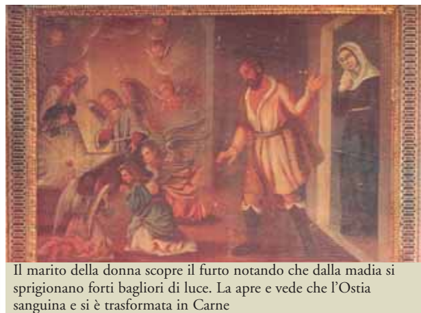
Il marito della donna scopre il furto notando che dalla madia si sprigionano forti bagliori di luce. La apre e vede che l'Ostia sanguina e si è trasformata in Carne