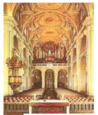
Interno della chiesa