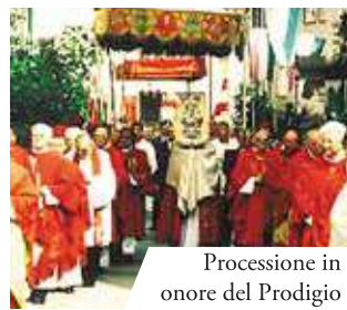
Processione in onore del Prodigio