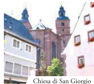
Chiesa di San Giorgio