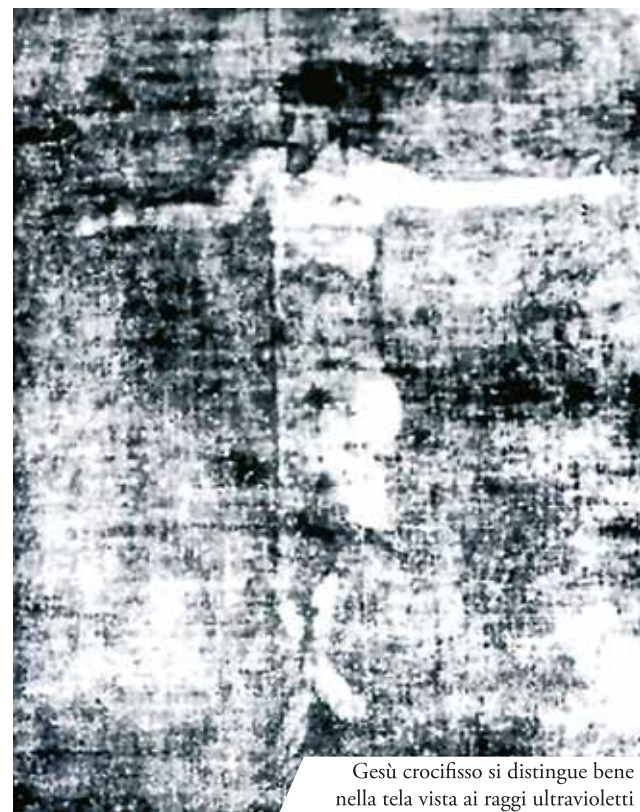
Gesù crocifisso si distingue bene nella tela vista ai raggi ultravioletti

Papa Eugenio IV confermò il Miracolo nel 1445 a cui concesse alcune indulgenze. Il Prodigio divenne famoso in tutta Europa e attraverso i secoli fu raffigurato da molti artisti. L'attuale Basilica fu costruita tra il 1698 e il 1728 da Franz Lothar von Schönborn, Arcivescovo di Mainz. Nel 1962, Papa Giovanni XXIII la elevò a Basilica Minore. Dal 1938 i monaci agostiniani guidano la Basilica.