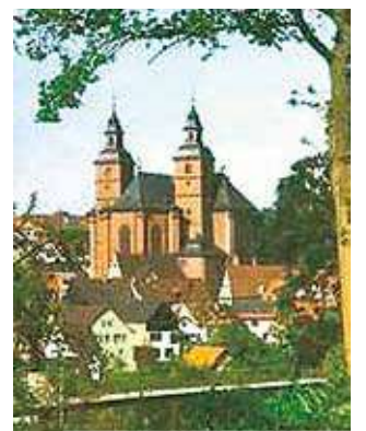
Kerk van St. George