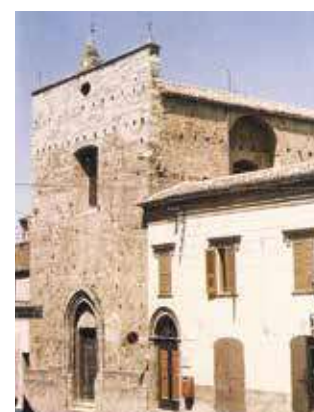
A Igreja de S. Francisco foi construída cerca de quinhentos anos depois, em 1258, sobre a capela onde se deu o milagre.