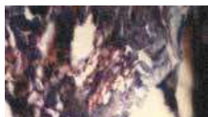
Um lóbulo do tecido adiposo