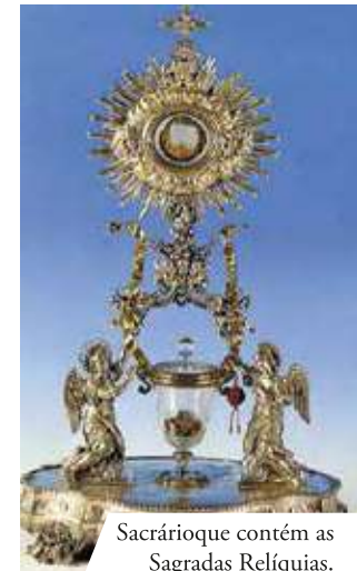
Sacrário que contém as Sagradas Relíquias.