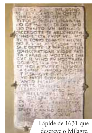
Lápide de 1631 que descreve o Milagre.