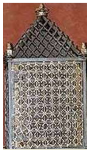
Grata cubica in ferro battuto dorato in cui furono custodite le Reliquie per circa 266 anni.