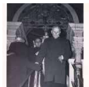
O Sumo Pontífice João Paulo II, naquela data Cardeal de Cracóvia, diante das SS. Relíquias, exprimindo assim a sua devoção.