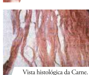
Vista histológica da Carne.

Os 5 grumos de Sangue vistos com uma lente de aumento. No Sangue do Prodígio identificam-se todos os componentes presentes no Sangue fresco e, Milagre dos Milagres, cada um dos 5 grumos pesa separadamente 15,85grs, que é igual ao peso dos 5 grumos pesados juntos!