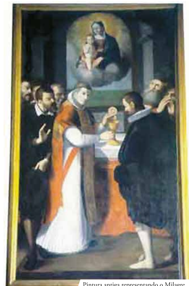
Pintura antiga representando o Milagre.