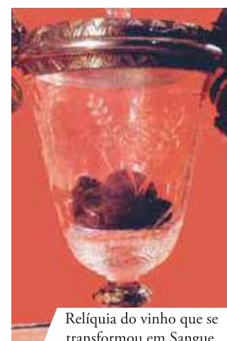
Relíquia do vinho que se transformou em Sangue.