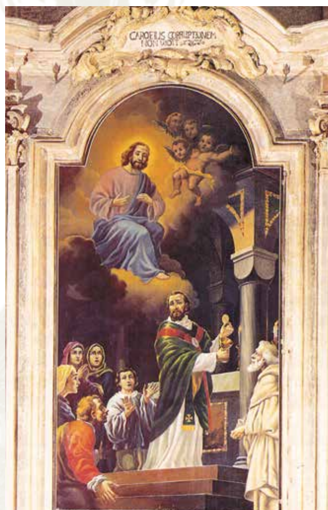
Pintura presente na Capela Valsecca que representa o Milagre.