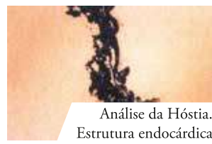
Análise da Hóstia. Estrutura endocárdica.