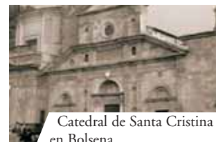
Catedral de Santa Cristina en Bolsena