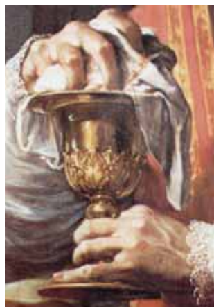
Francisco Trevisani. El Milagro de Bolsena, detalle