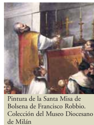
Pintura de la Santa Misa de Bolsena de Francisco Robbio. Colección del Museo Diocesano de Milán