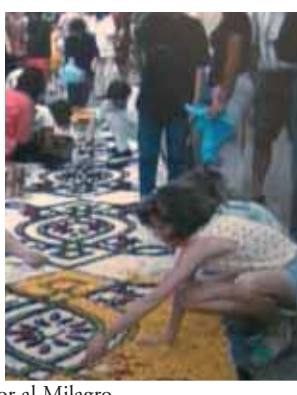
Alfombras de flores en honor al Milagro