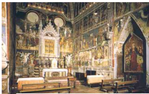
Catedral de Orvieto, capilla del Sagrado Corporal