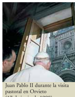
Juan Pablo II durante la visita pastoral en Orvieto (17 de junio de 1990)