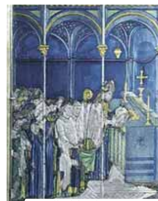
Detalle del Relicario