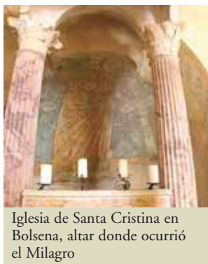
Iglesia de Santa Cristina en Bolsena, altar donde ocurrió el Milagro