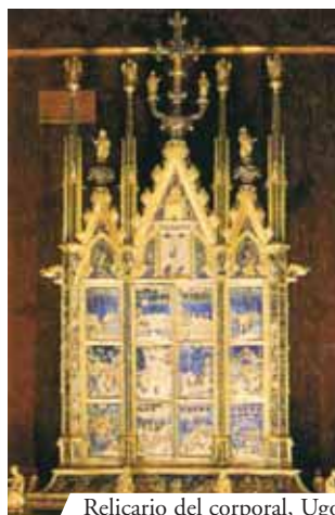
Relicario del corporal, Ugolino de Vieri (1338), Orvieto