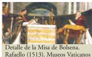
Detalle de la Misa de Bolsena. Raffaello (1513). Museos Vaticanos