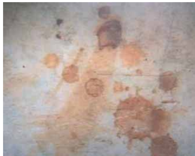
Detalle de la piedra manchada de Sangre, Bolsena