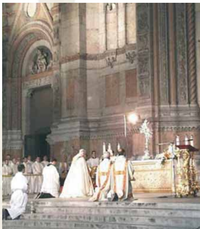
Adoración pública en honor a la fiesta del Corpus Domini, Orvieto