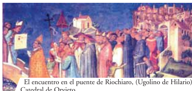
El encuentro en el puente de Riochiaro, (Ugolino de Hilario). Catedral de Orvieto