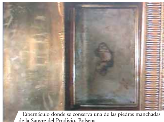
Tabernáculo donde se conserva una de las piedras manchadas de la Sangre del Prodigio, Bolsena