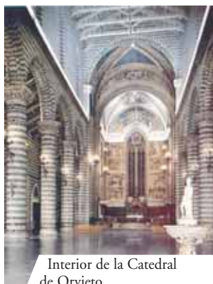
Interior de la Catedral de Orvieto