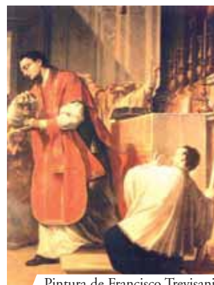
Pintura de Francisco Trevisani