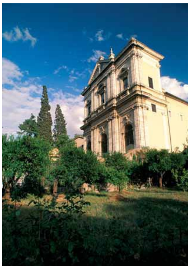
Iglesia de San Gregorio Magno en el Celio, Roma