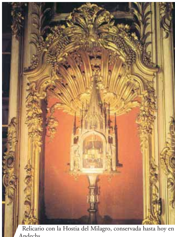
Relicario con la Hostia del Milagro, conservada hasta hoy en Andechs

Este Milagro Eucarístico, cuya reliquia se conserva aún en el monasterio benedictino de Andechs, en Alemania, ha sido certificado por numerosas fuentes escritas. Entre las obras más importantes en las que se menciona este Milagro Eucarístico, destaca la Vita Beati Gregorii Papae , escrita por el Diácono Paolo en el año 787. Corría el año 595, cuando el milagro se manifestó durante una celebración eucarística presidida por el Papa San Gregorio Magno, quien fue testigo en primera persona.