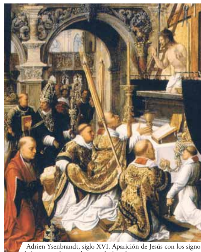
Adrien Ysenbrandt, siglo XVI. Aparición de Jesús con los signos de la Pasión durante la Misa de San Gregorio.

llegaba a entender cómo fuese posible que aquel pan que ella misma había preparado con sus manos, ahora, gracias a las palabras de la consagración, se convirtiera en el Cuerpo y la Sangre de Cristo. San Gregorio le prohibió comulgar e imploró a Dios que la iluminase. Cuando terminó su oración, vio que la fracción preparada por la mujer se convertía en carne y sangre. La mujer, con gran arrepentimiento, se arrodilló y comenzó a llorar. Aún hoy, una parte de la Reliquia del Milagro se conserva en Andechs, Alemania, en el monasterio benedictino.