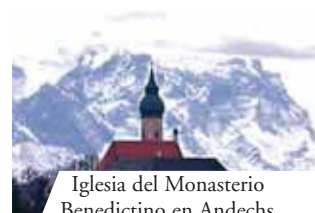
Iglesia del Monasterio Benedictino en Andechs

E n el momento en que una mujer noble de Roma se acercó a comulgar, comenzó a reírse porque dudaba de la real presencia de Cristo en el pan y en el vino consagrados. Entonces, el Papa, turbado por tal incredulidad, decidió no darle la comunión. Inmediatamente las especies de pan se convirtieron en carne y sangre.