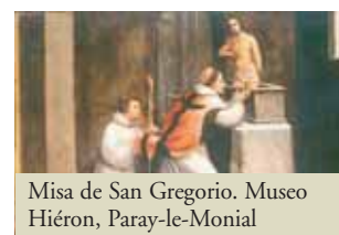
Misa de San Gregorio. Museo Hiéron, Paray-le-Monial