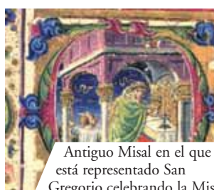
Antiguo Misal en el que está representado San Gregorio celebrando la Misa