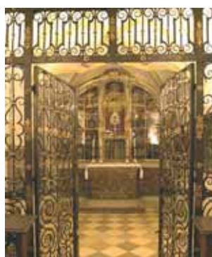
Capilla donde se conserva la Reliquia en Andechs