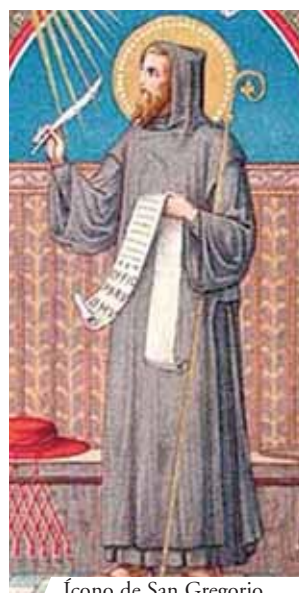
Ícono de San Gregorio