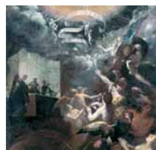
Misa milagrosa en la que San Gregorio libera muchas almas del Purgatorio