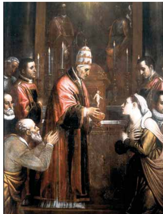
Misa milagrosa de San Gregorio Magno, Domingo Cresti (1559-1638)