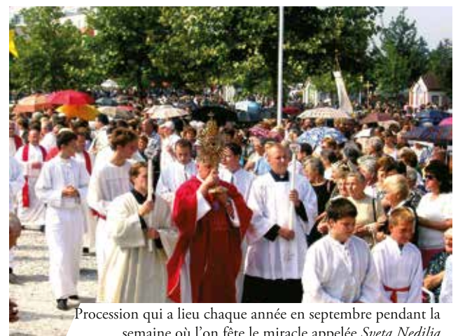
Procession qui a lieu chaque année en septembre pendant la semaine où l'on fête le miracle appelée Sveta Nedilja