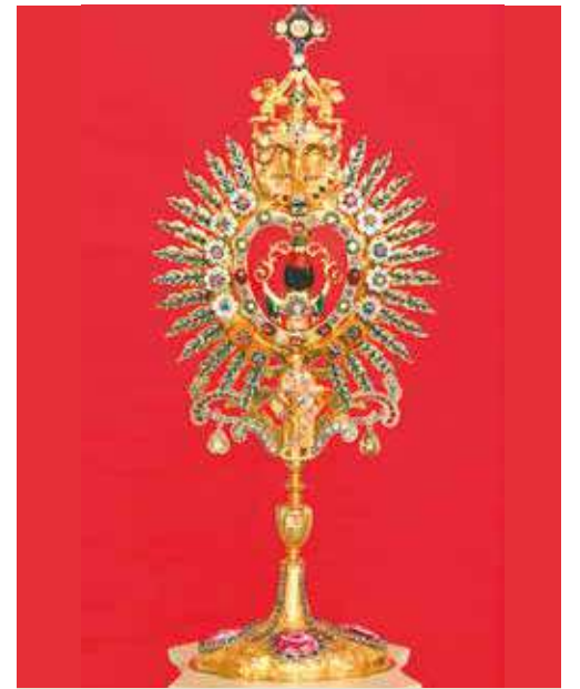
La relique du Très Précieux Sang est conservée depuis 1721 dans un précieux ostensorio de l'école des orfèvres de Augsbourg, commandé par la comtesse Eléonore Batthyany-Strattman qui l'offrit à l'église de Ludbreg