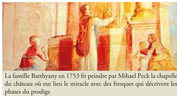
La famille Batthyany en 1753 fit peindre par Mihael Peck la chapelle du château où eut lieu le miracle avec des fresques qui décrivent les phases du prodige