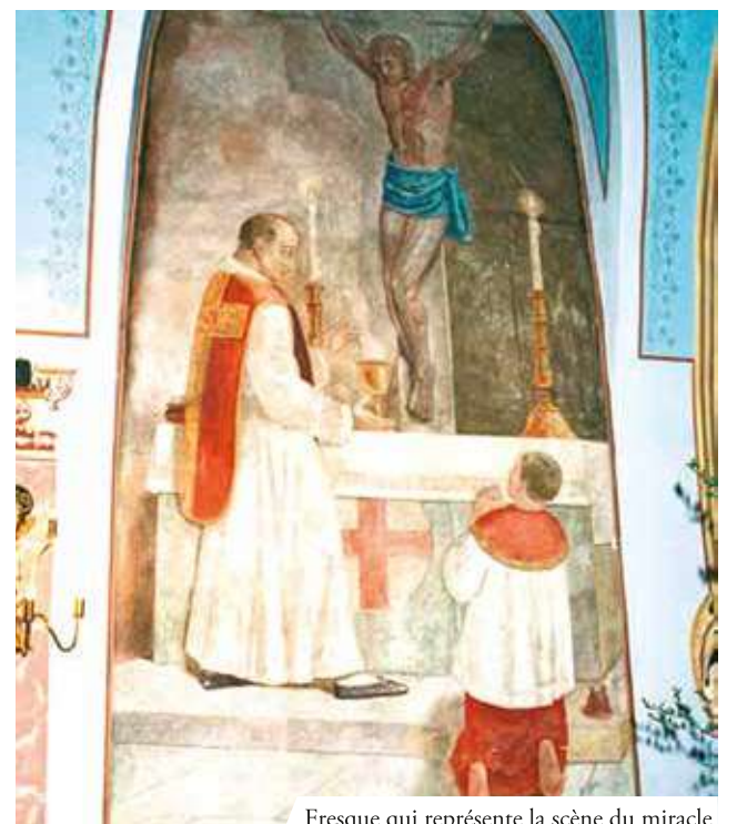
Fresque qui représente la scène du miracle

En 1411, à Ludbreg, dans la chapelle du château des comtes Batthyany, un prêtre célébra la messe. Pendant la consécration du vin, le prêtre douta de la vérité de la transsubstantiation et le vin dans le calice se transforma en sang. Le prêtre ne sachant que faire décida de murer cette relique derrière le maître-autel. L'ouvrier qui exécuta le travail fut obligé de garder le silence. Le prêtre aussi respecta le secret qu'il révéla seulement en mourant. Après cette confession, la nouvelle se répandit rapidement et les gens commencèrent à venir en pèlerinage à Ludbreg. Par la suite le Saint-Siège fit amener à Rome la relique du miracle où elle resta pendant plusieurs années. Les habitants de Ludbreg et de ses alentours continuèrent de faire des pèlerinages dans la chapelle du château. Au début de l'an 1500, pendant le pontificat du pape