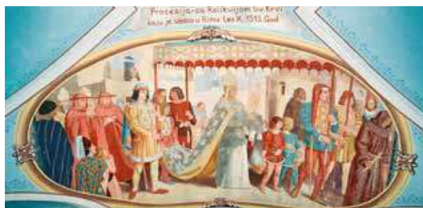
Fresque représentant la procession qui eut lieu à Rome en 1513 pendant laquelle le pape Léon X porte dans les rues de la ville la précieuse relique