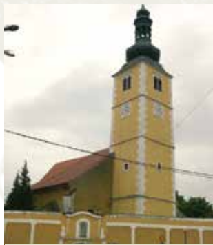
Chapelle du château de la famille Batthyany où a eu lieu le miracle