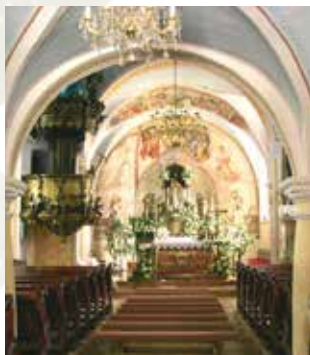
Intérieur de la chapelle du château de la famille Batthyany