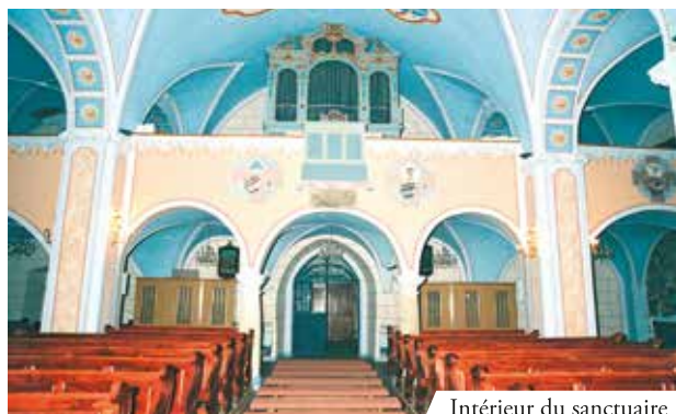
Intérieur du sanctuaire