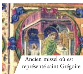
Ancien missel où est représenté saint Grégoire