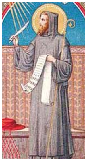
Icône de saint Grégoire le Grand