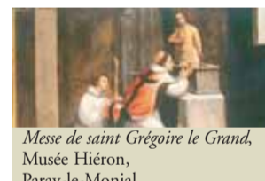
Messe de saint Grégoire le Grand, Musée Hiéron, Paray-le-Monial