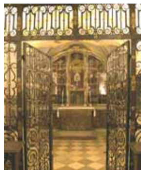
Chapelle où est conservée la relique à Andechs