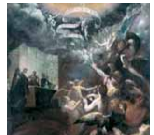
Messe miraculeuse pendant laquelle saint Grégoire le Grand délivre de nombreuses âmes du purgatoire