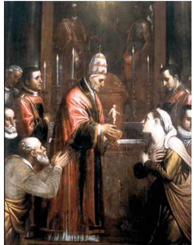
Messe miraculeuse de saint Grégoire le Grand. Domenico Cresti (1559-1638)