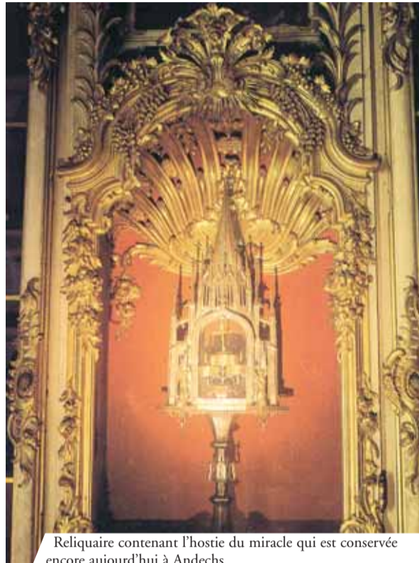
Reliquaire contenant l'hostie du miracle qui est conservée encore aujourd'hui à Andechs

La relique de ce miracle eucharistique est conservée à Andechs, en Allemagne, dans un monastère bénédictin. Le prodige eut lieu à Rome en 595 pendant une célébration eucharistique présidée par le pape Grégoire le Grand. Au moment de recevoir la communion, une noble dame romaine se mit à rire, prise de doutes sur la présence réelle dans le pain et le vin consacrés. Le Pape alors, troublé par le manque de foi de cette femme, décida de ne pas lui donner la communion et aussitôt le pain se transforma en chair et en sang.