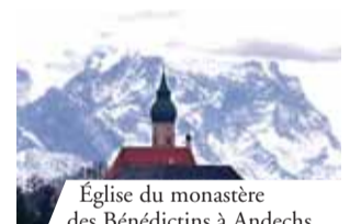
Église du monastère des Bénédictins à Andechs

Parmi les œuvres les plus importantes relatant ce miracle eucharistique qui eut lieu à Rome en 595, il y a la Vita Beati Gregorii Papae écrite par le diacre Paul en 787.