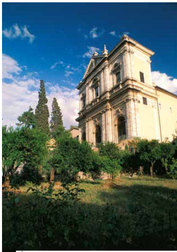
Église Saint-Grégoire-le-Grand au Celio, Rome